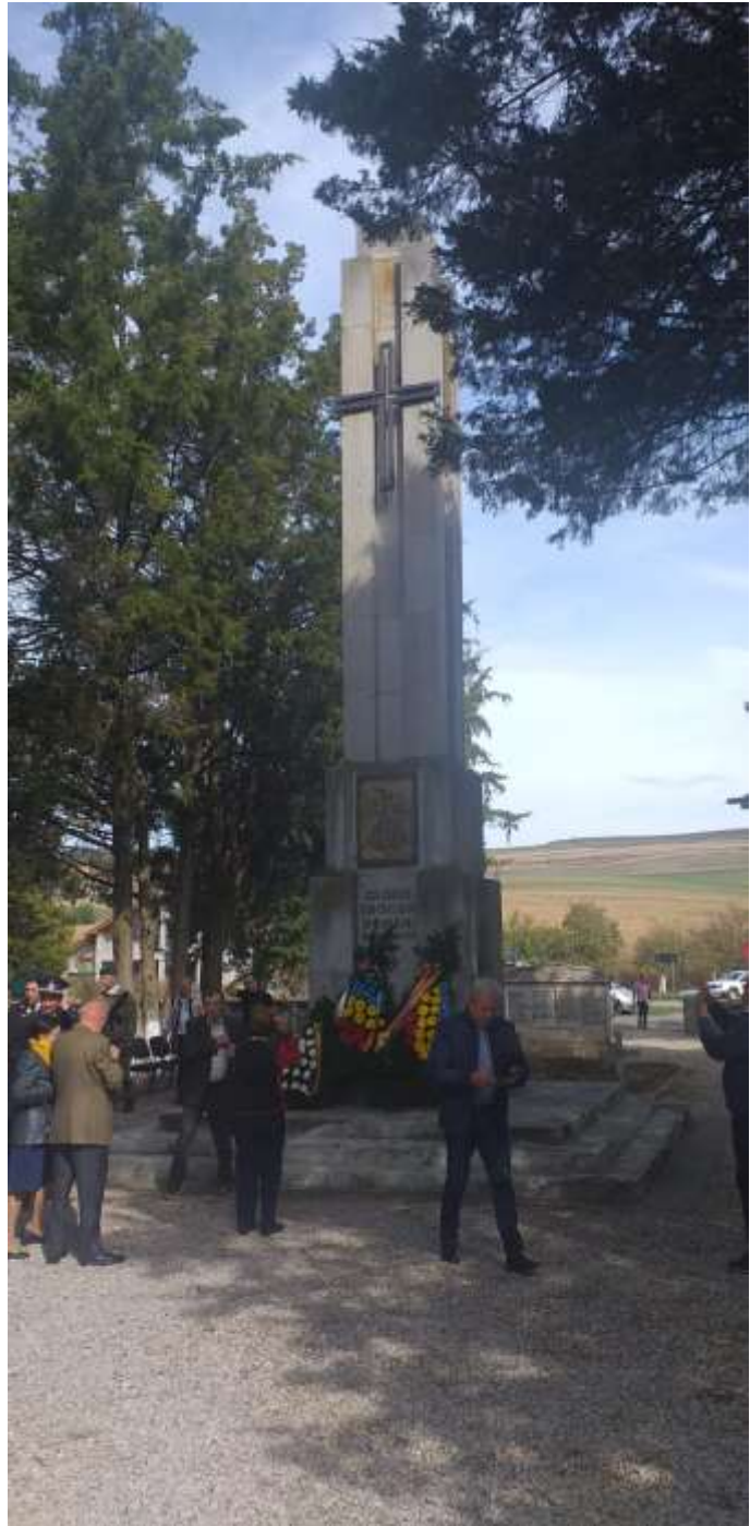
Monumentul Eroilor – Oarba de Mureș