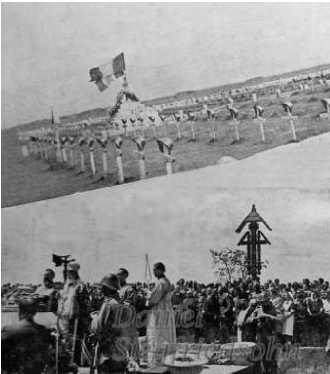
Cimitirul Eroilor români de la Dalnic