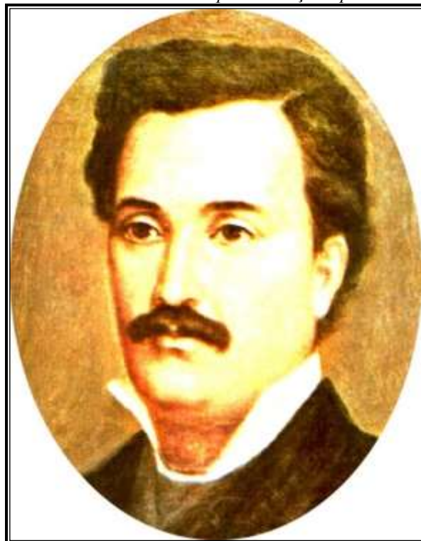
Mihai Eminescu- pictura Mișu Pop

perioada cât M. Eminescu a lucrat ca director al Bibliotecii Centrale Universitare, a îndeplinit și alte atribuțiuni, trasate de minister. Astfel, el a colaborat la dicționarul Brockhaus , la propunerea lui Maiorescu, care scrie lui Negruzzi: „Fă bine amintește lui Eminescu să-mi comunice de urgență lista tuturor articolelor, despre care crede, că trebuie să figureze în Conversation-Lexicon Brockhaus , precum și acelor ce ar trebui eliminate din ultima edițiune. Am primit o scrisoare de la Brockhaus, care aprobă colaborarea lui Eminescu”.