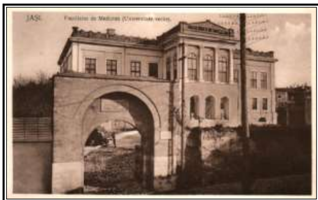
Localul Bibliotecii Universitare Iași- ilustrată 1915

Eminescu face aceeași greșală ca la primirea inventarului și nu face numărătoarea cărților la predare, deși mai continuă activitatea de bibliotecar încă două luni, Petrino intrând în concediu. Acest lucru va duce la acel proces rușinos, intentat de Petrino, pe motiv ca lipsesc o parte din cărți și parte din mobilier, purtându-l pe Eminescu prin justiție, proces politic la inițiativa liberalilor ieșeni.