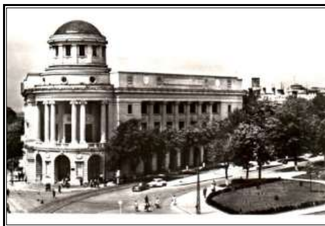
Nicolae Iosub, august 2024, Botoșani