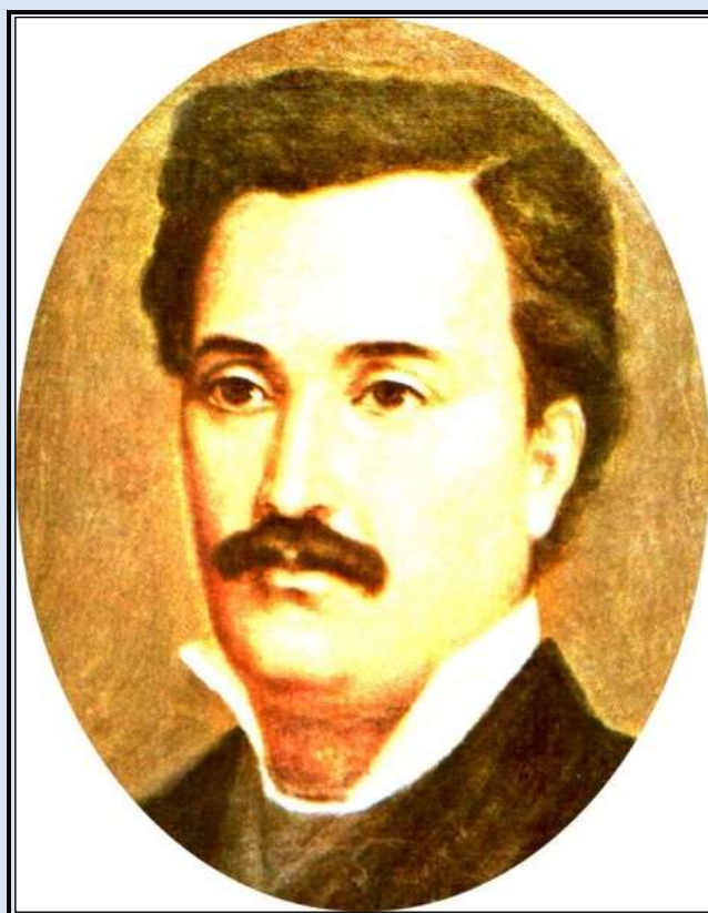
Mihai Eminescu- pictura Mișu Pop

În perioada cât M. Eminescu a lucrat ca director al Bibliotecii Centrale Universitare, a îndeplinit și alte atribuțiuni, trasate de minister. Astfel, el a colaborat la dicționarul Brockhaus , la propunerea lui Maiorescu, care scrie lui Negruzzi: „Fă bine amintește lui Eminescu să-mi comunice de urgență lista tuturor articolelor, despre care crede, că trebuie să figureze în Conversation- Lexicon Brockhaus , precum și acelor ce ar trebui eliminate din ultima edițiune. Am primit o scrisoare de la Brockhaus, care aprobă colaborarea lui Eminescu”.