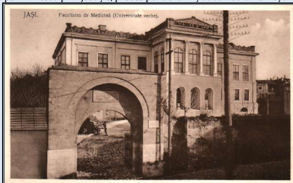
Localul Bibliotecii Universitare Iași- ilustrată din 1915

Eminescu face aceeași greșală ca la primirea inventarului și nu face numărătoarea cărților la predare, deși mai continuă activitatea de bibliotecar încă două luni, Petrino intrând în concediu. Acest lucru va duce la acel proces rușinos, intentat de Petrino, pe motiv ca lipsesc o parte din cărți și parte din mobilier, purtându-l pe Eminescu prin justiție, proces politic la inițiativa liberalilor ieșeni.