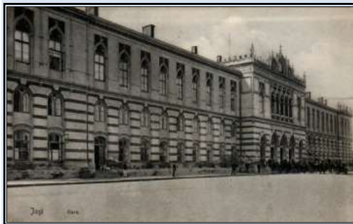
Gara feroviară din Iași- ilustrată din 1912 Aici sosește Eminescu în 1874

Mihai Eminescu, la preluarea funcției de bibliotecar, scrie Veronicăi Micle: „Sunt fericit că mi-am ales un loc potrivit cu firea mea singuratică și dornică de cercetări. Ferit de grija zilei de mâine, mă voi confunda ca un budist în trecut, mai ales în trecutul nostru atât de măreț în fapte și oameni. Voi fi obligat moralmente d-lui Pogor care m-a găzduit și care mi-a găsit acest culcuș dem pentru iernile mai friguroase... Înțeleg prin ierni, schimbarea răutăcioasă a semenilor noștri, care caută să lovească chiar și-n cei ce nu se pot apăra. Cunosc năravurile politice de la noi, de aceia mă îngrijesc, cu toate că trebuie să mă bucur de norocul ce-a dat peste mine” (Fragment de scrisoare către Veronica Micle din 14 septembrie 1874).