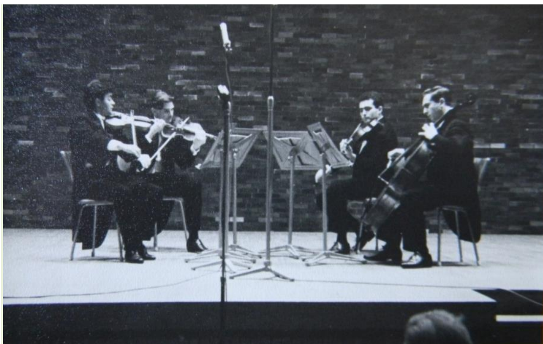
Benone Damian la vioara întâi în cvartetul de coarde, pe scena Sălii Palatului Regal din București

Pe parcursul unei cariere îndelungate, activitatea sa a fost singulară în calitate de violonist și solist