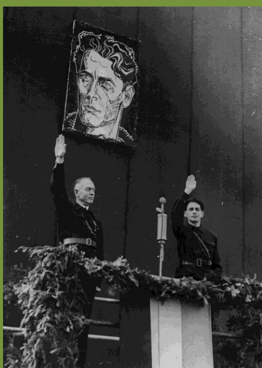
Generalul Ion Antonescu cu Horea Sima noiembrie 1940