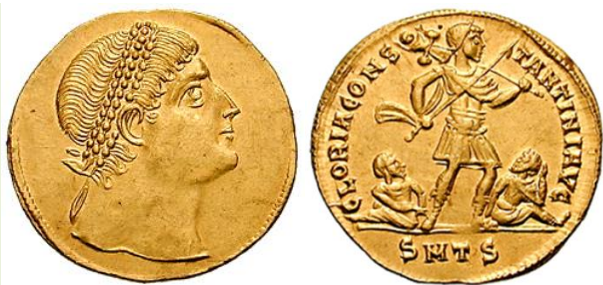
Monedă de 1 1/2 Solidus, emisă sub Constantin cel Mare; 6,83 g de aur; avers: Cap, spre dreapta, poartă drept diademă trei benzi de perle, ochii ridicați la cer; revers: circular, inscripția GLORIA CONSTANTINI AVG; în centru, spre dreapta, în picioare, Constantin ține transversal o lance, în mâna dreaptă și un trofeu peste umărul stâng, iar doi captivi la picioarele lui; jos, în exergă, inscripția SMTS

Și spre știință amintesc câteva date despre cel numit Badea Cârțan, pe numele său adevrat Gheorghe Cârțan, țaran român originar din Cârțișoara Sibiului, ce rămas în istorie ca un mare luptător pentru cauza românilor de pretutindeni. Într-o vreme în care