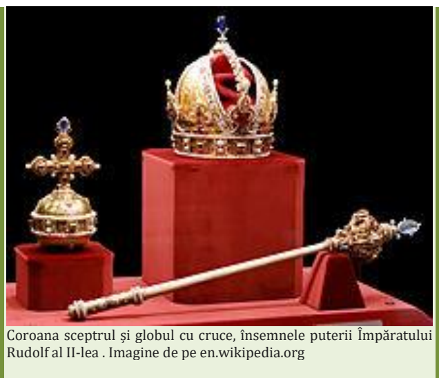
Coroana sceptrul și globul cu cruce, însemnele puterii Împăratului Rudolf al II-lea .

Indicația cea mai importantă dată solilor, primul și cel mai important punct al cererii sale, sună așa: „ Împăratul Măria Lui și Țara Ungurească să caute bine aceasta, că Mihail Voievod Domnia Lui n'a gândit cu aceasta că are-a fi el în gura Turcilor și în loc de peire, în Țara-Rumânească, ce, toată frica lăsând înapoi, ispitit-a stricte mare. N'a gândit de paguba țerii într-atâția ani, și dechelchiugul lui ce în toate stricștile a ispitit în băsăul Turcilor. Ardealul încă, ce sânt 74 de ani de când a fost lepădat de supt Curuna Țerii Ungurești și a fost închinat Turcilor, iar Mihail Voievod, cu tocmeala lui și cu peire a mulți voinici, a luat Ardealul și l-a închinat cinstului Împărat, și de acum înainte se făgăduiește dumnealui, pân' va fi viu, cu mare credință va slui împăratului și Țerii-Ungurești și toată Creștinătatea. Ce se roagă împăratului și Țerii Ungurești să-i socotească pentru această slujbă și nevoiță ce s'a nevoit, să-i lase țara Rumânească și țara Ardelului să-i fie de moșie lui și cine se va ținea din feciorii lui să le fie moșie. ” – „Scrisori de boieri, Scrisori de Domni”-Nicolae Iorga- 1925