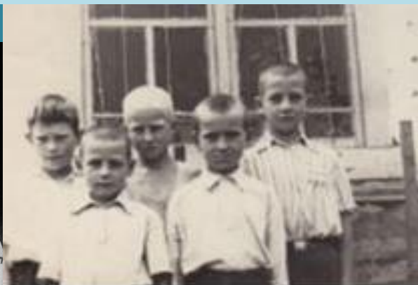
Anii de copilărie în orașelul Cegdomyn