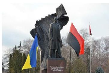
Monumentul din Ternopil