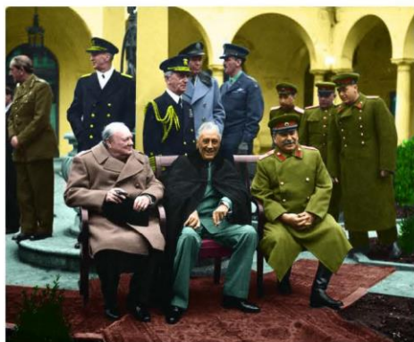
Yalta, 4-11 februarie 1945