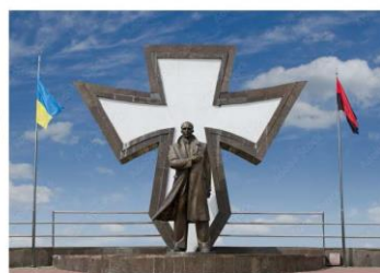
Monumentul din Ivano-Frankivsk