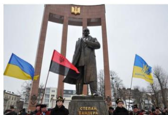
Monumentul din Lwov