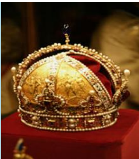
Coroana lui Rudolf al II-lea care a devenit coroana imperială a Imperiului Austriac

Autoritatea pontificală voia să joace și ea un rol important, pentru că Transilvania era condusă până acum de prinți catolici. Ea voia să aibă un cuvânt de spus în numirea acestor principii, care trebuiau să fie după opinia sa, catolici. Cardinalul Andrei Báthory pierise,