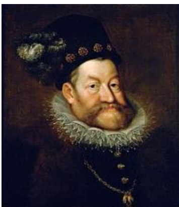
Rudolf al II-lea, Împărat al Sfântului Imperiu Romano-German (1576-1612), rege al Ungariei și Croației (1572-1608) rege al Boemiei (1575-1608) și arhiduce al Austriei (1576-1608)

Acum, după cucerirea Ardealului, pentru Mihai începea o fază mai dificilă în relația cu Rudolf al II-lea. Multe necunoscute au apărut o dată cu moartea lui Andrei Báthory și venirea lui Mihai în scaunul princiar din Ardeal. „Cu ce gânduri a venit el ?” - se întrebau imperialii.