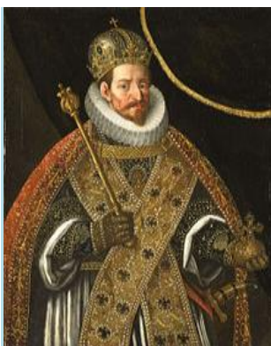
Matthias Arhiducele, fratele lui Rudolf al II-lea, devenit împărat al Sfântului Imperiu Roman în 1612. A domnit până în 1619. Începând cu 1608, a devenit și rege al Ungariei iar din 1611, și rege al Boemiei

Mihai mai spune: „Aș vrea cât mai iute să trec Dunărea spre a păgubi pe dușman, mergând de-a dreptul la Adrianopol.” Solul lui Mihai, îi transmitea împăratului că Mihai are de gând să lovească în porțile Constantinopolului, iar cu ce oaste plină de vitejie are, ar putea trece și mai departe.