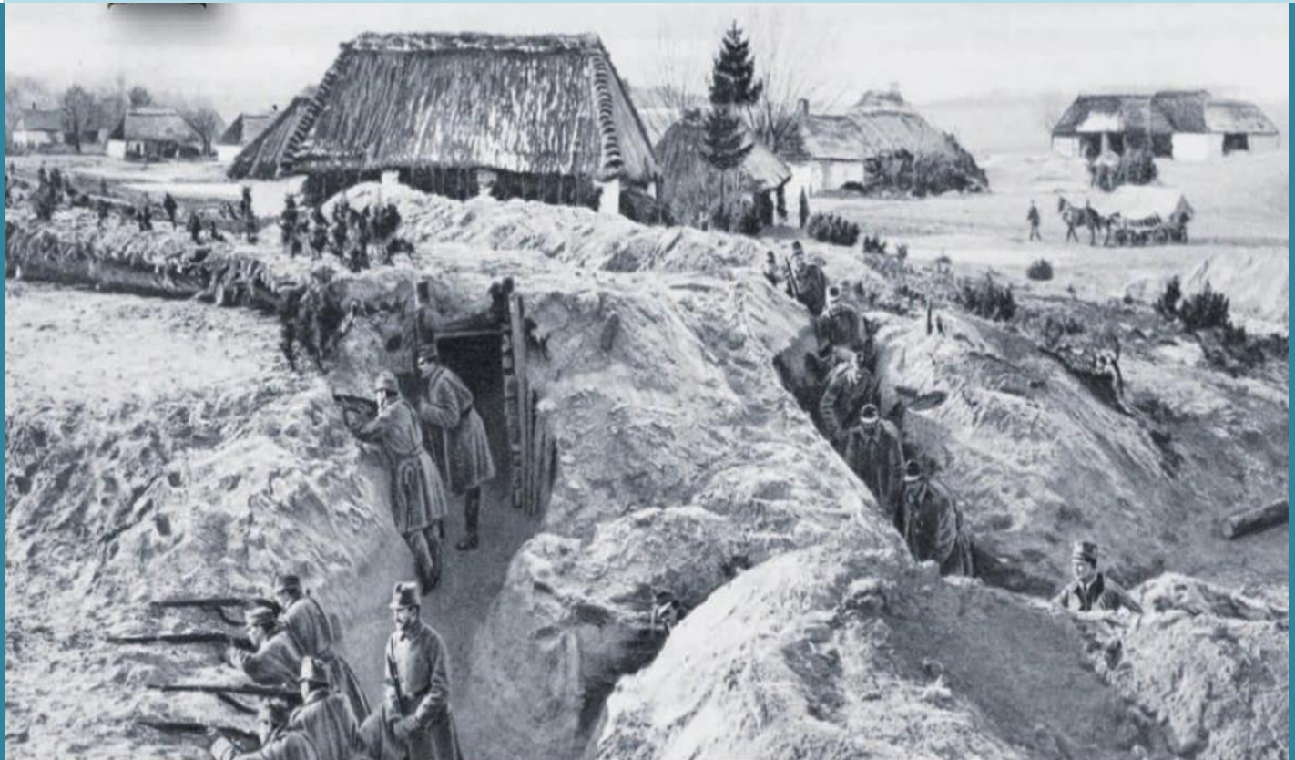
Soldați din armata austro-ungară în apărare (iarna, tranșee dublă), contra rușilor în Galiția

Odinioară acel timp al bărbăției presupunea și sacrificiul familial. De aceea, după Marele Război, cum i se zicea prin zona de vest războiului de Întregire Națională, unii cetățeni, care trebuiau să satisfacă stagiul militar obligatoriu, dregeau cereri pentru dispensă. Foarte interesantă pare a fi fost starea de spirit a populației din zona de la granița de vest a României Mari. În baza ordinului nr. 662 se răspundea punctual la chestiuni privitoare la „starea sufletească” a populației, care era măcinată de frica unui eventual nou război „fascist și comunist” 1 , după cum circulau zvonuri care amenințau Europa, după cum raporta șeful de post de jandarmi din Episcopia Bihor, în 1923.