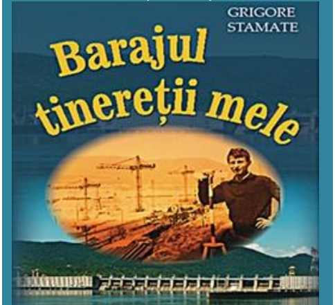
Barajul tinereții mele