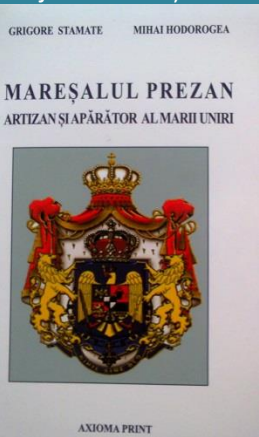
Maresalul Prezan Artisan al Marii Uniri