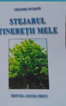
Stejarul tinereții mele