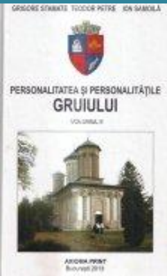
Personalitatea si personalitatile Gruului