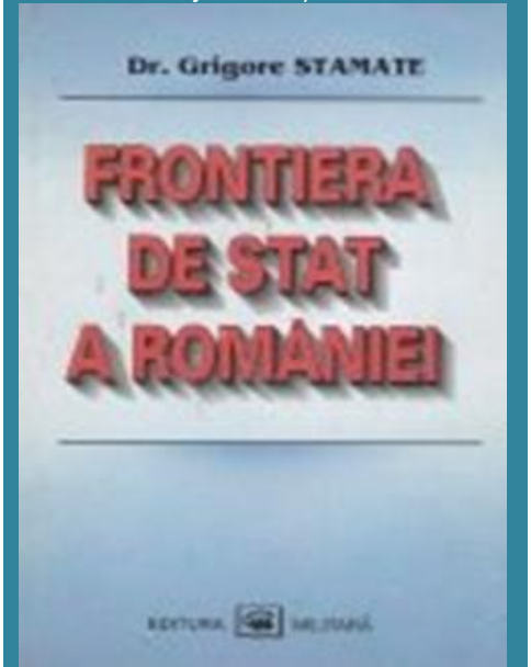
Frontiera de stat a României