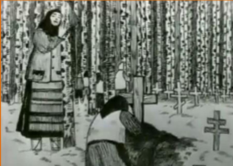
Mame basarabence își deplâng copiii decedați.