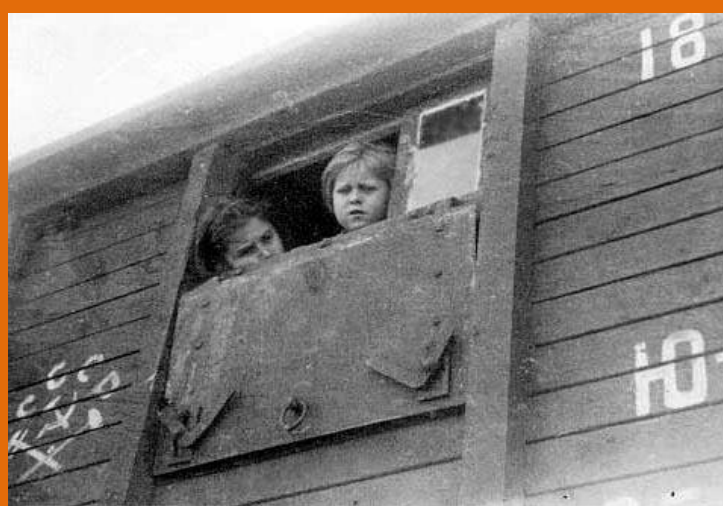
Copii deportați privesc cu tăngă meleagurile părăsite prin fereștrica bou- vagonului sovietic.

Pe parcursul perioadei 28 iunie 1940-13 iunie 1941 căpcăunii din Kremlin și slugoii de pe loc au pregătit minuțios așa-numita operație „... Po iziatiu antisovetskogo elementa v Moldavskoj SSR, Chernovitzkoj i Izmail'skoj oblasti ” (...referitor la scoaterea elementelor antisovietice în RSSM și regiunile Cernăuți și Ismail). Conform DEX, sensul cuvântului „ iziatie ” are următoarele sensuri: retragere (din circulație a unor obiecte); confiscare (a unor obiecte) etc. După cum se vede oamenii erau priviți de