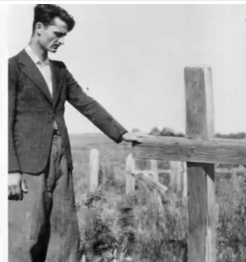
Un tânăr basarabean la mormântul mamei.

Pe parcursul perioadei 28 iunie 1940-13 iunie 1941 căpcăunii din Kremlin și slugoii de pe loc au pregătit minuțios așa-numita operație „... Po iziatiu antisovetskogo elementa v Moldavskoj SSR, Chernovitzkoj i Izmail'skoj oblasti ” (...referitor la scoaterea elementelor antisovietice în RSSM și regiunile Cernăuți și Ismail). Conform DEX, sensul cuvântului „ iziatie ” are următoarele sensuri: retragere (din circulație a unor obiecte); confiscare (a unor obiecte) etc. După cum se vede oamenii erau priviți de