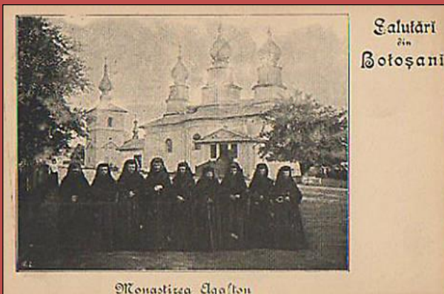
Salutări în Botoșani