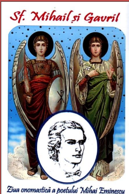
Ilustrată cu Eminescu și Sf. Mihail și Gavril