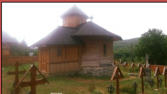
Agafton- Biserica Sf. Voievozi, renovată și cimitirul, 2010