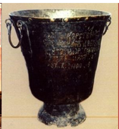
Biserica Uspenia Botoșani unde a fost botezat Mihai Eminescu și cristelnița de botez