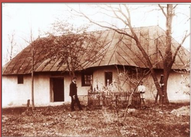
Biserica Sf. Mihail și Gavril Ipotești și mormintele părinților poetului