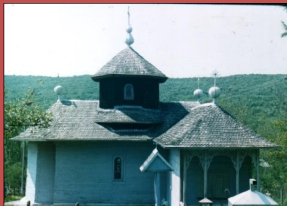
Mănăstirea Agafton- Biserica veche

Raluca Eminovici trăgându-se dintr-o familie cu trei surori călugărițe și cu doi frați călugări, ținând strânse legături cu ei, ajutându-se la nevoie unii pe alții, a făcut ca să-și educe copiii în spiritul credinței și a respectului față de biserica ortodoxă română și a slujitorilor ei.