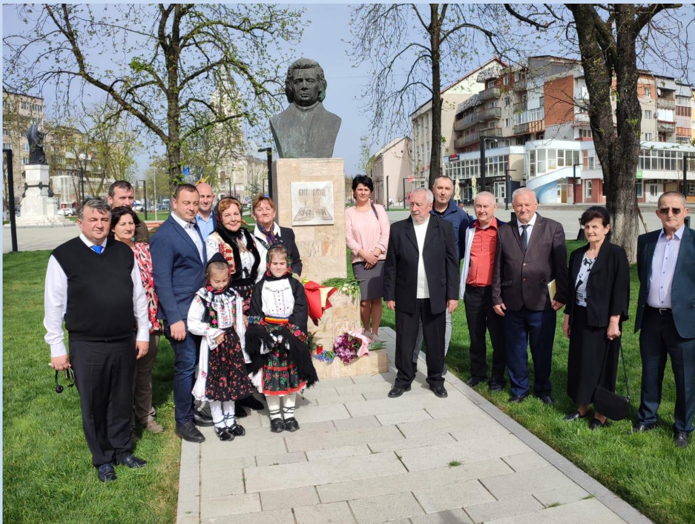
Grup la Bustul poetului Pituț, din Beiuș