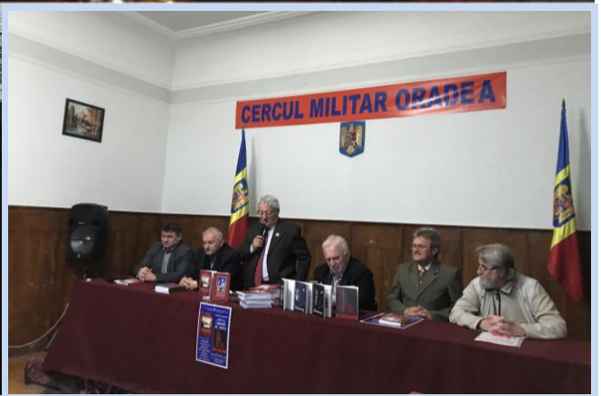
Lansarea volum: Biserica Albastră (2.10 2023)-Cercul Militar (17.10 2023)