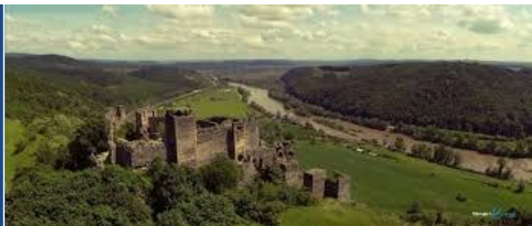
Cetatea Șoimoș, Lipova. Cetatea Șoimoș se află pe malul drept al Mureșului, vizavi de Lipova și deasupra satului cu același nume, pe un deal înalt de 252 metri. A fost construită după primele invazii ale tătarilor în zonă și este atestată documentar din anul 1278.

Transilvania, Mihai a început organizarea noului stat. Cărmuirea Transilvaniei, a cărei organizare de stat era deosebită față de cea din Țara Românească, presupunea o serioasă strategie adaptată realităților de aici, probleme pe care Mihai trebuia să le rezolve cât mai judicios și cu cât mai