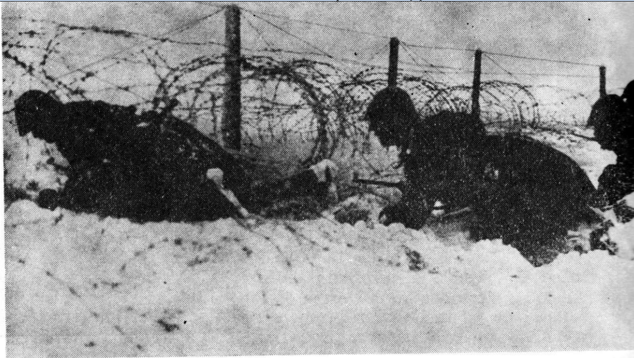
Ostași români în luptele din valea Hernádului

În ofensiva declanșată de Armata a IV-a pe Valea Hernadului (10 decembrie, ora 10.00) 3 , Divizia a 3-a Infanterie a avut misiunea să atace a localitățile Hălmaj și Felsokászmark.