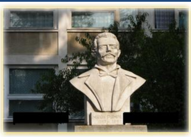
Bust M. Pompiliu- Școala generaă din Ștei