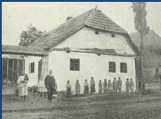
Ștei. Casa în care s-a născut Miron Pompiliu

La 26 de ani de la moartea lui Miron Pompiliu (în 1923), autoritățile și cetățenii din Ștei, se achitau „de o sfântă dorință față de memoria lui Miron Pompiliu, însemnându-și casa, unde s-a născut, prin o tablă comemorativă”. S-a făcut un parastas în fața casei poetului, la care a participat întregul sat și s-a înființat biblioteca populară, donând 65 de volume (revista Vestul României, 13 iulie 1923). Căminul cultural din Ștei și o stradă poartă numele lui Miron Pompiliu.