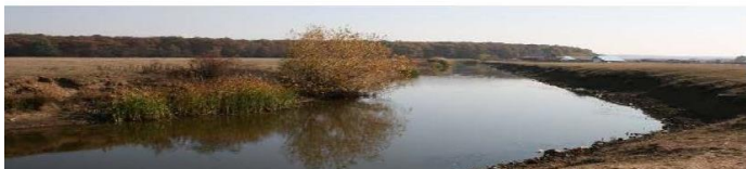
Traseul fortificațiilor - Șanțul antitanc