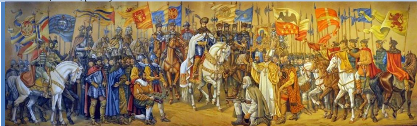
Intrarea lui Mihai în Alba Iulia –pictură de Valentin Tănase

La 11 Noembrie 1599 Mihai-Vodă îi adresează dar, din Alba-Iulia 2 , o scrisoare, în care-i înșiră titlurile dobândite conform cutumelor din epocă: „ Mihail, Voivodul Valachiei Transalpine, consiliarul și loțiitorul în Transilvania al Majesății Sale cesare și rege sacratisime și căpitanul suprem al oștirilor aceleași Majestăți în Transilvania și în ținuturile și părțile ei supuse ”, etc.» Scrisoarea către Basta cuprindea următoarele: « Spectabile și magnifice Domnule, amice nouă prețuite, am înțeles, că Domnia-Voastră magnifică a intrat cu oștirile Maiestății Sale și acum pradă aceste ținuturi ale Majestății Sale, ocupând cetăți și castele. După ce Maiestatea Sa divină a dăruit Majestății Sale această provincie și noi ne-am constituit în acest loc, nu se cuvine ca regiunea aceasta să fie pustiită, ci, după putință, mai virtos apărută, știind ce fel de instrucțiuni avem de la Maiestatea Sa, ceea ce veți fi înțelegând și Domnia-Voastră magnifică. Ajutorul magnificenței Voastre nu se mai cere acum, dacă nu ați venit atunci, când vi se cerea. De aceea Vă rog prieteneste pe magnificența Voastră să scoateți oștirile acestea, ca să nu mai asuprească aceste ținuturi ale Majestății Sale... » (Documente privitoare la Istoria Românilor, culese de E. Hurmuzachi, Vol. III, p. 351).