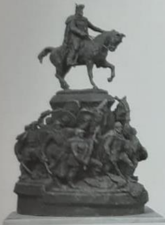
Statuia ecvestră a lui Mihai Viteazul din curtea Mănăstirii Dealu

ULTIMII ANI AI VEACULUI AL XVI-LEA AU FOST, PENTRU ROMÂNII DE PRETUTINDENI, MARCAȚI DE MIHAI VOIEVOD VITEAZUL (1593-1601), PRIMUL CARE S-A PUTUT NUMI „DIN MILA LUI DUMNEZEU, DOMN AL ȚĂRII ROMÂNEȘTI, AL ARDEALULUI ȘI A TOATĂ ȚARA MOLDOVEI”, UNIRE CE ÎMPLINEA UN GÂND PROGRAMATIC, ATÂT DE EXPRESIV ROSTIT DE DOMNUL ÎNSUȘI: „... POHTA CE AM POHTIT...”