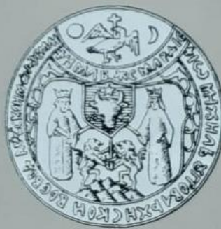
STEMA CELOR TREI ȚĂRI ROMÂNEȘTI UNITE.

Handwritten signatures and text in Cyrillic script, including the name Mihai Viteazul.