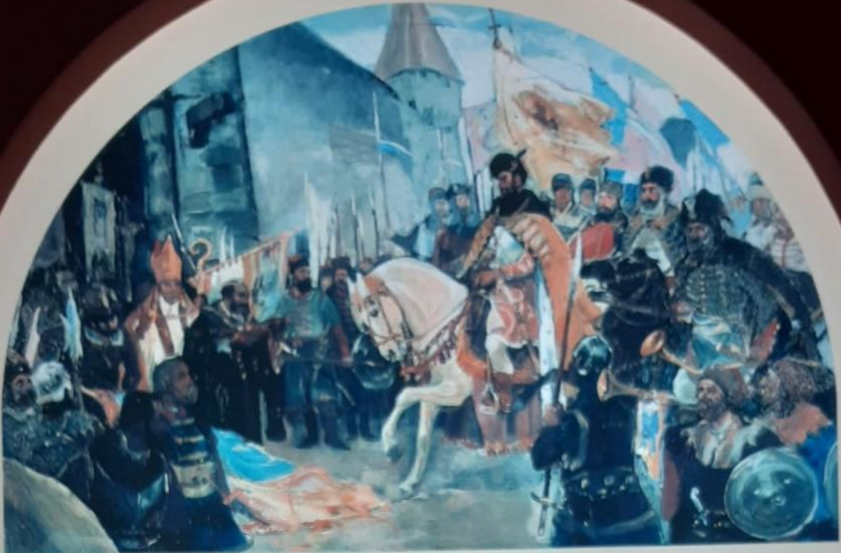
INTRAREA LUI MIHAI VITEAZUL ÎN ALBA IULIA - 1599

ULTIMII ANI AI VEACULUI AL XVI-LEA AU FOST, PENTRU ROMÂNII DE PRETUTINDENI, MARCAȚI DE MIHAI VOIEVOD VITEAZUL (1593-1601), PRIMUL CARE S-A PUTUT NUMI „DIN MILA LUI DUMNEZEU, DOMN AL ȚĂRII ROMÂNEȘTI, AL ARDEALULUI ȘI A TOATĂ ȚARA MOLDOVEI”, UNIRE CE ÎMPLINEA UN GÂND PROGRAMATIC, ATÂT DE EXPRESIV ROSTIT DE DOMNUL ÎNSUȘI: „... POHTA CE AM POHTIT...”