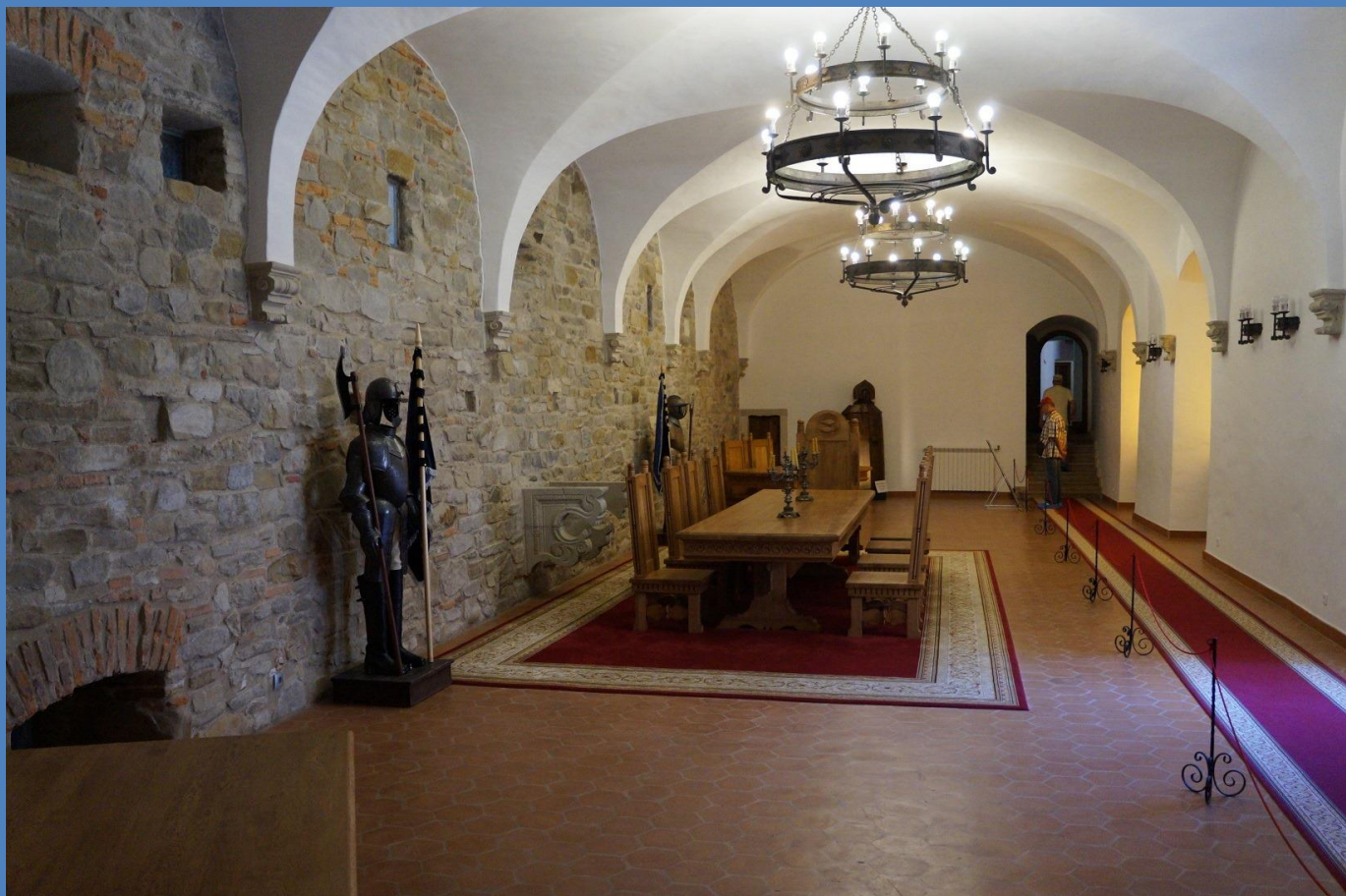
Sala Dietei din Făgăraș

„Iata privilegiul vostru!”, și Mihai bate cu mânerul sabiei sale masa Dietei din Alba