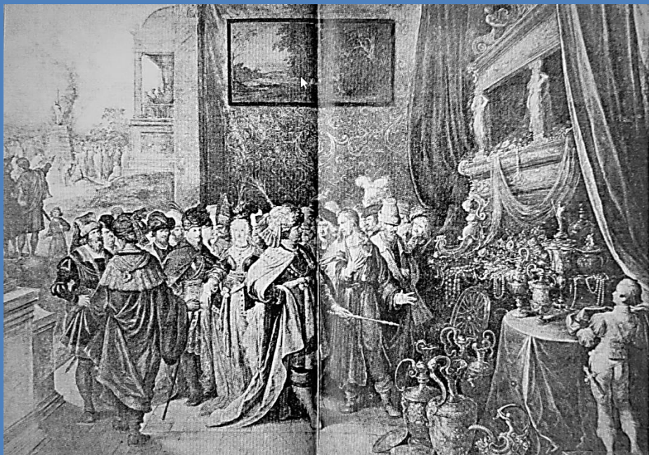
Mihai Viteazul la Praga, foto tip Gutenberg, Josef Göbl., Vatra , p.389

Despre prezumtiva moștenire aflăm din scrisoarea trimisă la 1627 de văduva lui Nicolae – Vodă Pătrașcu, în numele său și al copiilor, prin care roagă pe Împăratul Austriei să ordone Palatinului Ungariei ca să nu mai amâne, sub tot felul de pretexte, procesul privitor la averile dăruite răposatului ei soț. Conform legislației de atunci a Transilvaniei, „donățiile regale” se întorceau la fisc dacă se stingea „familia aceluia care primea donația”, deoarece regele nu putea păstra pentru sine acele averi odată donate, dar avea dreptul să le doneze unui alt „credincios al său”, stipula legea. Într-o