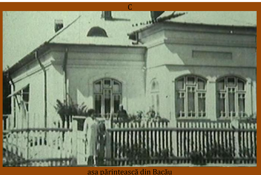
asa părintească din Bacău