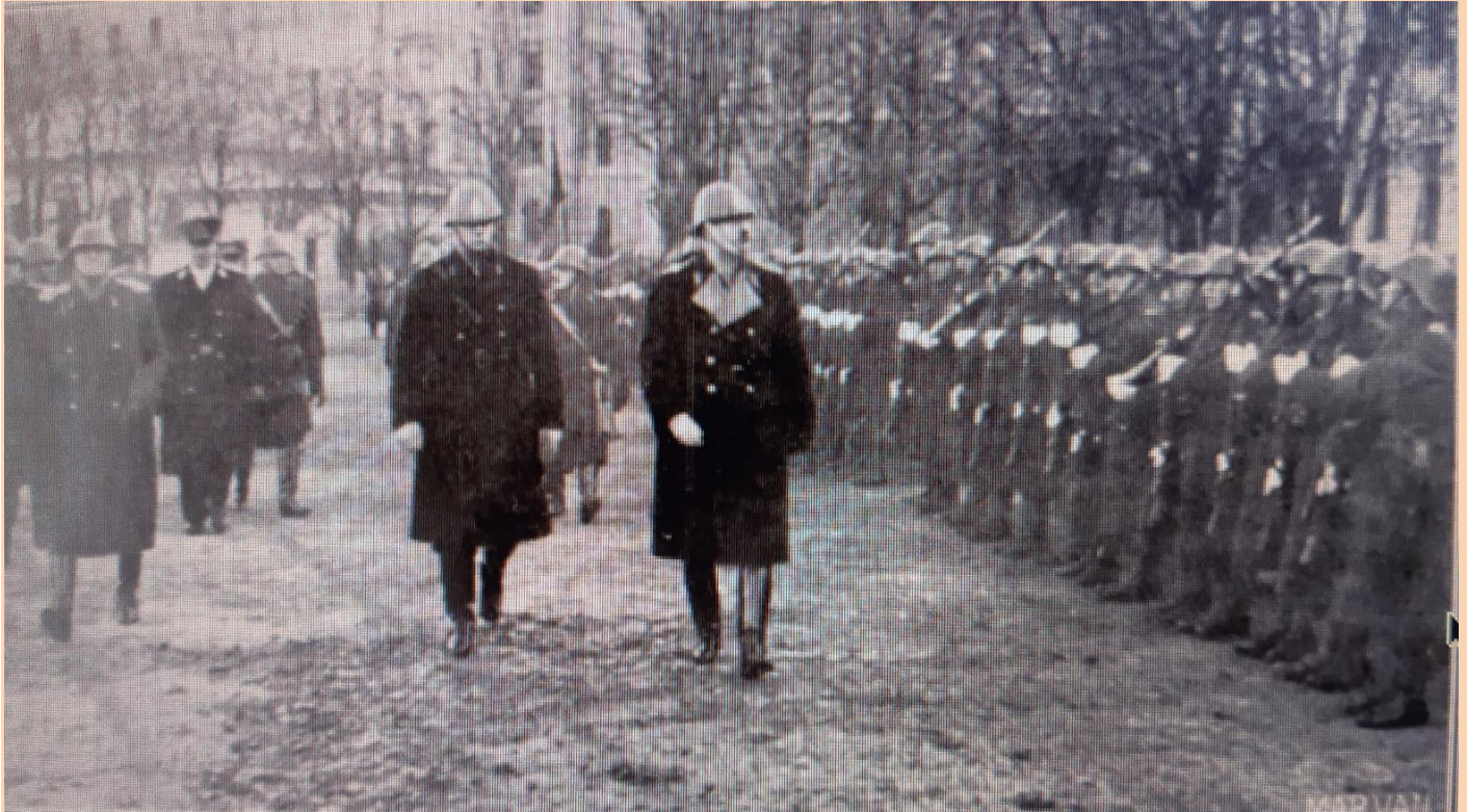
Regele Carol II, trece în revistă Garda de Onoare în curtea Regimentului 85 Infanterie - 25 decembrie 1939

participarea activă și efectivă a populației la strângerea de fonduri, de donații și acțiuni de împădurire, de educație patriotică și pregătire civilă de apărare a lucrărilor de artă, etc. Minoritarii din zonă, ațâțați de acțiunile ziarelor ungurești, de nucleeele teroriste ce s-au menținut în „adormire” după Trianon, și agenți infiltrați serveau intereselor maghiare. În această atmosferă Regele Carol II a făcut o vizită regală de Crăciun la unitățile din Garnizoana Oradea. Din parcurgerea presei care a relatat evenimentul am reținut cele ce urmează..