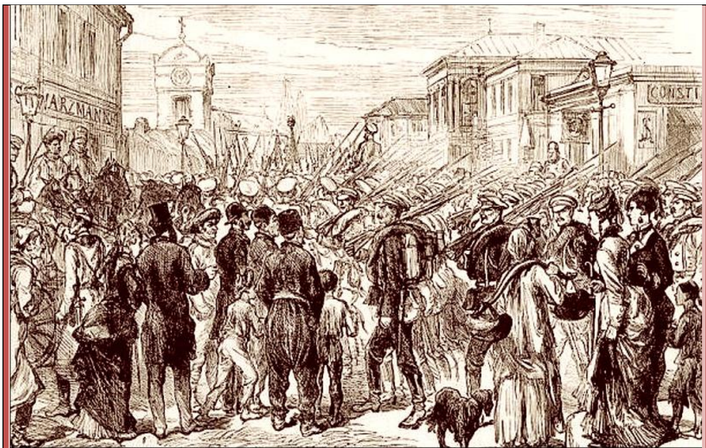
1877: intrarea trupelor rusești în București

A doua trădare, cea din Primul Război Mondial, și apoi infiltrația comunistă în presa și politica