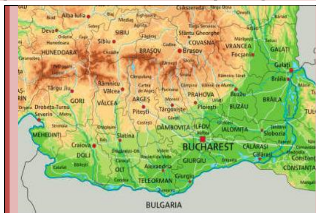
Harta geografică actuală a României La est de Valea Prahovei se află Valea Teleajenului, iar la est de aceasta, Valea Buzăului