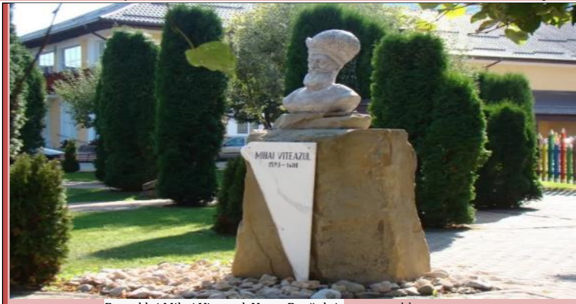
Bustul lui Mihai Viteazul, Vama Buzăului.

La 5/25 octombrie 1599, Mihai pătrunde în Ardeal prin Pasul Buzăului.