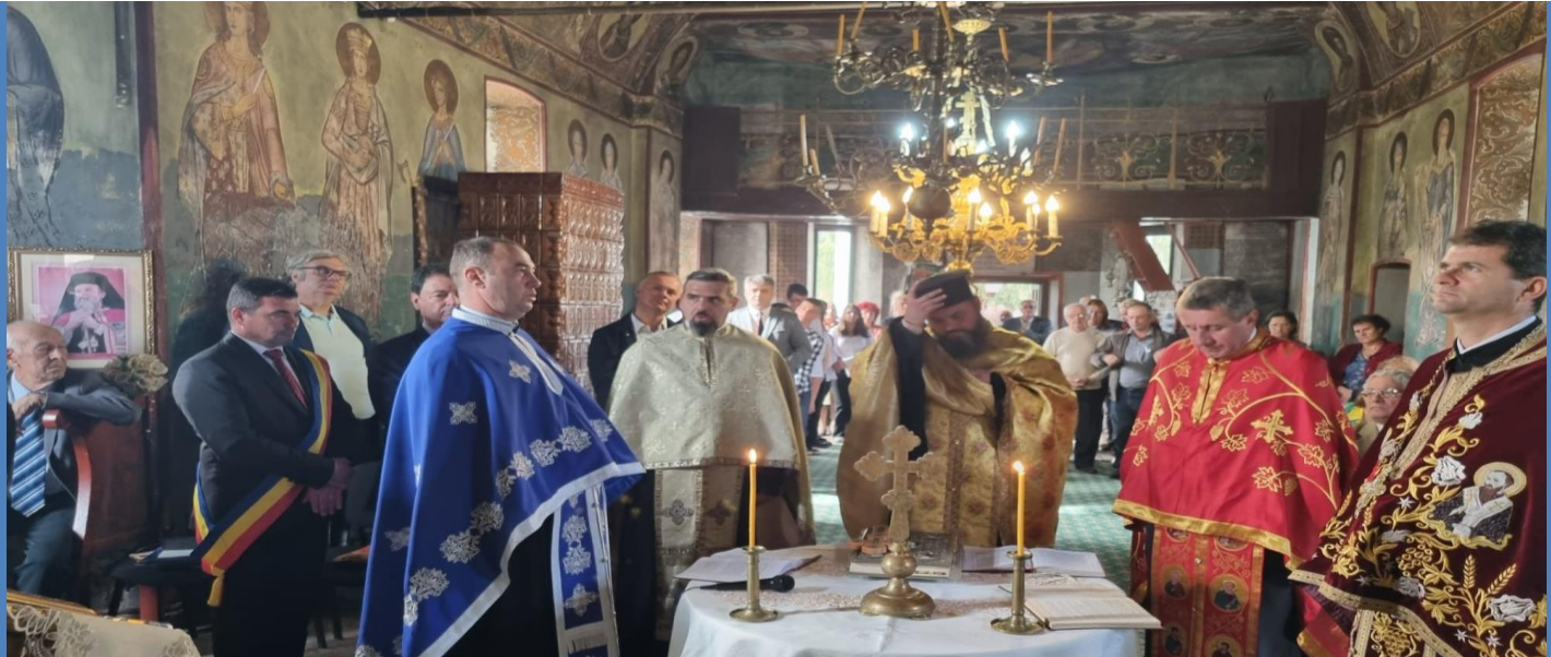
Te-Deum – Grup participanți