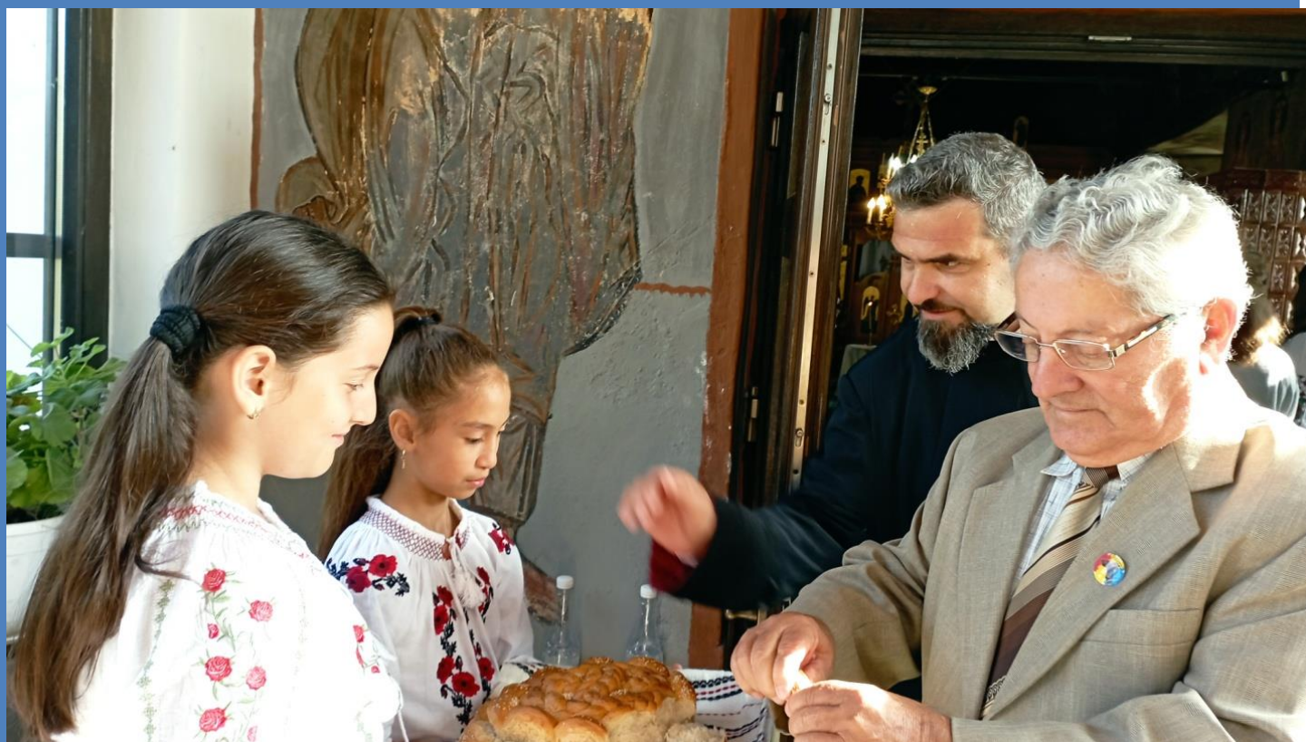
Primiți cu pâine și sare