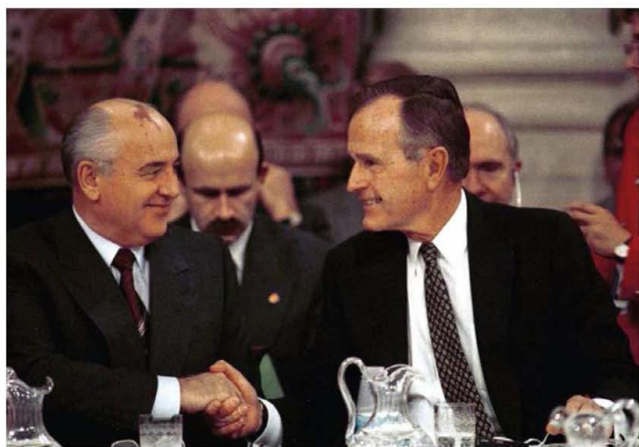
Ultima strângere de mână oficială, Madrid

“În treacănt fie zis –i s-a adresat tatonant Gorbaciov lui Bush – toți liderii republicilor doresc să lucreze direct cu dumneavoastră. Asta vă creează oportunitatea de a vă exprima punctul de vedere”, sugerând o influențare explicită a acestor lideri din partea lui Bush, în favoarea păstrării Uniunii. Președintele american a trebuit să confirme existența contactelor directe cu liderii republicilor, eschivându-se, însă, de la această influențare: “Da, i-am primit pe Kravciuc și pe Akaiev. Avem contacte cu republicile și încercăm să nu vă subminăm poziția. Desigur, subiectele sunt și militare, de dezarmare, armament nuclear. Intențiile Ucrainei în această privință [o armată proprie de 450.000 de militari] ne-au neliniștit profund.”