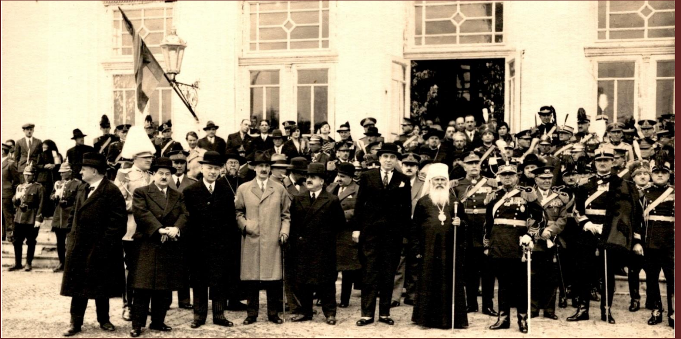
Patriarhul Miron Cristea și Nicola Titulescu la Satu Mare