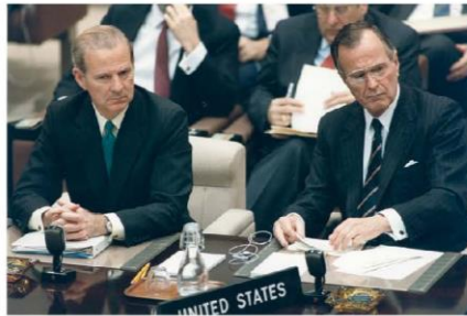
James Baker G.W.H. Bush