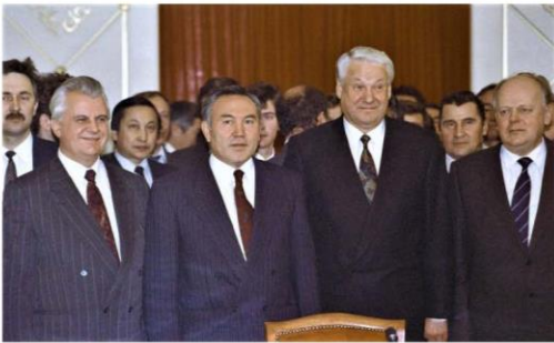
Kravciuk Nazarbaev Elțin Șușkievici