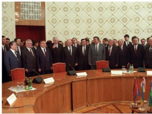
Mircea Snegur al treilea în stânga lui Elțin