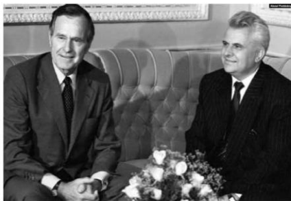
G.W.H. Bush Leonid Kravciuk