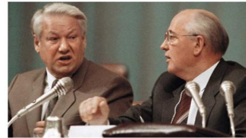
La Congresul IV al Deputaților Poporului

Peste câteva zile, Elțin nu se mai formalizează. Urmează o cascadă de decrete prezidențiale prin care RSFSR își adjudecă proprietatea asupra tuturor întreprinderilor și instituțiilor unionale aflate pe teritoriul RSFSR, inclusiv asupra instituțiilor guvernamentale unionale. La 25 august, toate proprietățile Partidului Comunist de pe teritoriul RSFSR devin proprietăți de stat ale RSFSR. În octombrie, RSFSR încetează finanțarea ministerelor unionale, cu excepția Ministerului Apărării, Ministerului Comunicațiilor și a Ministerului Energiei Atomice. La 6 noiembrie Elțin dă un decret de desființare a Partidului Comunist al RSFSR. Toată puterea centrală este golită de conținut.