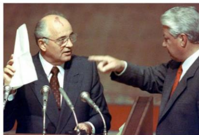
În Sovietul Suprem al RSFSR