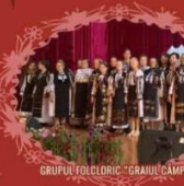
GRUPUL FOLCLORIC "GRAIUL CAMPULUI"