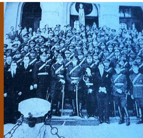
Promoția 1917 la absolvirea Școlii Pregătitoare de Geniu

În fiecare colț al soclului se află poziționați câte