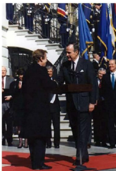
Vaclav Havel G.H.W. Bush