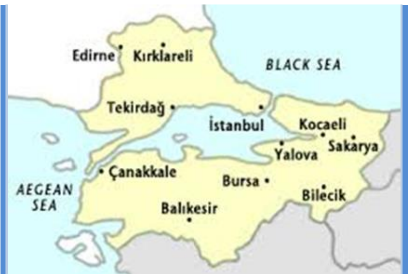
Harta Turciei - zona Mării Marmara. Localitatea Edîrne figurează în vestul extrem al țării.

Ambasadorul Spaniei la Veneția, Inigo de Mendosa îi confirmă regelui Filip al III-lea știrile despre victoriile obținute de Mihai la sud de Dunăre (document din 21 noiembrie 1598): „Înfrângerea despre care s-a spus că a pricinuit-o Mihai-Voievod pașalelor turcului a fost confirmată și înfățișată pe larg; anume că a luat Vidinul, Filipopolis și Nicopole, care este la două sau trei zile de Adrianopole și nu mai mult de șase zile de Constantinopol... din care pricină s-a răspândit o spaimă de necrezut în