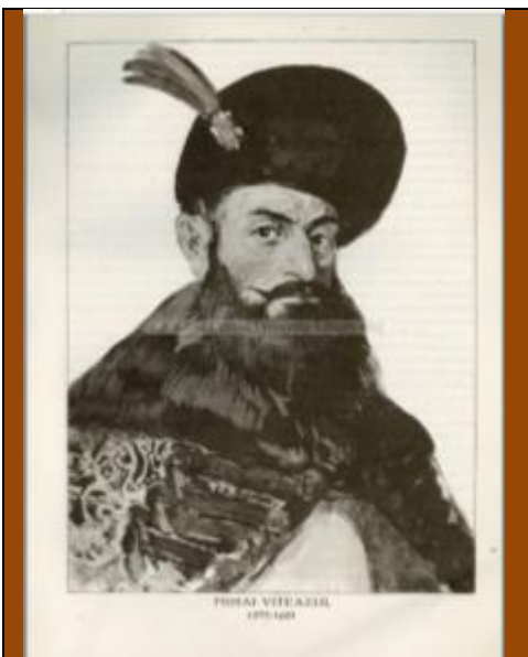
Mihai Viteazul din „Cartea Unirii”-1918-de Cezar Petrescu

Împăratul se obliga să-i trimită bani pentru întreținerea unei armate cu soldă de 5.000 de oameni precum și pentru alți 5.000 de ostași dacă țara era atacată. În caz că Transilvania ar fi fost atacată, Valahia se angaja să-i ofere ajutor atât cu oastea valahă, cât și cu oastea plătită de împărat. Tot în tratatul încheiat cu Rudolf, Mihai primea în cazul în care ar fi vrut să părăsească tronul, un castel în Ungaria sau Transilvania, acolo unde ar fi urmat să trăiască pe banii monarhului conform rangului său. Prin nouă puncte se prevedeau promisiuni referitoare la ajutor armat și pecuniar. Au mai fost menționate și alte clauze, care au fost acceptate de ambele părți. Mihai nu era obligat la plata vreunui tribut sau alte dări, ci doar la un cadou „cuvincios și potrivit.” Valahia rămânea sub domnia urmașilor lui Mihai. Se mai stipulau libertăți comerciale, etc.