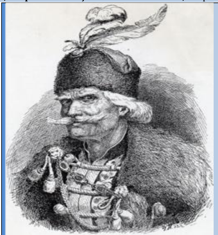
Haiducul Starina Novac, numit Baba Novac, căpitan sârb, de mare încredere al Viteazului Mihai.

Marko Segedinak, numit și Deli Marcu (Marcu nebunul, sălbatecul) haiduc și luptător voluntar, viteazul care s-a alăturat oastei române, a adus mari servicii lui Mihai și implicit luptei antiotomane, cu ceata sa de sute de viteji, care se înrolau voluntar în aceste bătălii, contra otomanilor. El avea o mare experiență încă din tinerețe, când a servit în armata habsburgilor, tot în luptele contra otomanilor. În anul 1594, a apărat Craiova de o armată otomană, pe care a urmărit-o până la Vidin, exterminând-o complet. Apoi, a participat și la bătălia