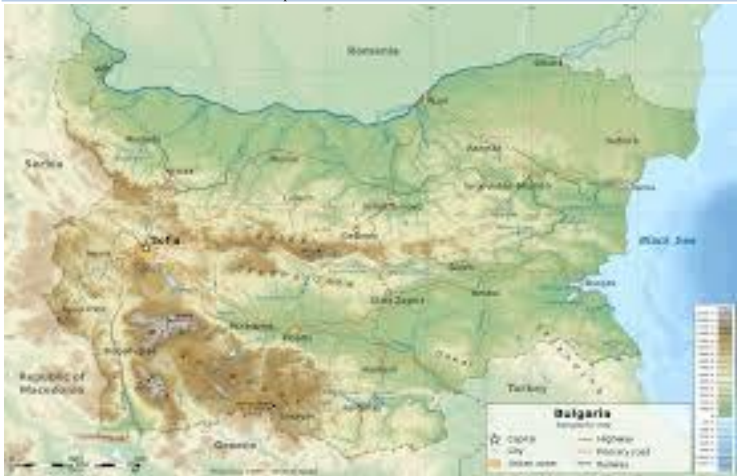
Harta Balcanilor.

Declanșarea revoltei lui Mihai și succesele sale împotriva turcilor, încrederea deosebită în acțiunile sale antiotomane, din anul 1594 și 1595, a generat pregătirea unei răscoale a creștinilor din Balcani; Bulgaria, Serbia, Herțegovina, Croația, Macedonia, Grecia, Albania, popoarele de aici, considerându-l conducătorul moral al luptei antiotomane din zonă.