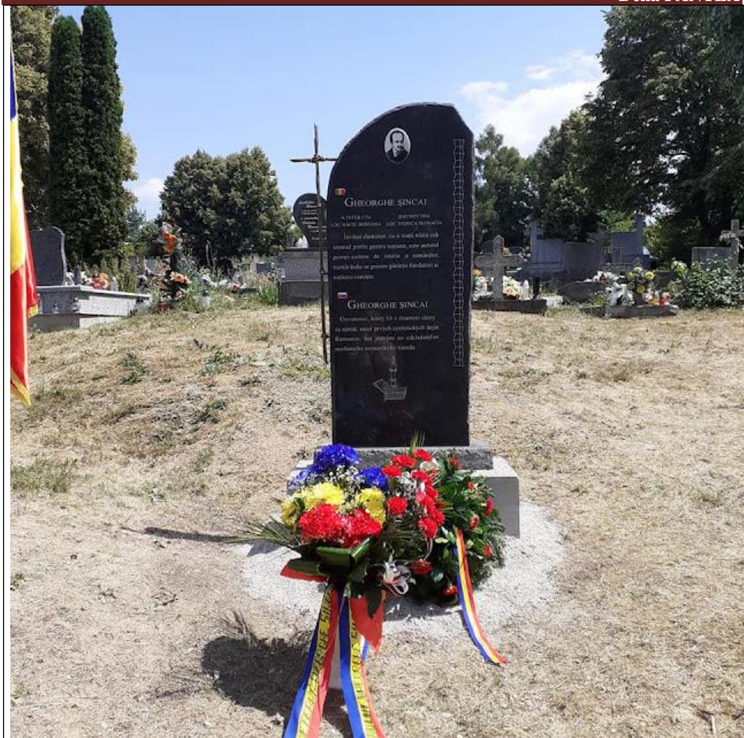
La 206 ani de ani de la moartea lui Gheorghe Șincai, Primăria comunei Râciu împreună cu Primăria din Svinica au dezvelit și sfințit în cimitirul din localitatea Svinica un monument ridicat în memoria cărturarului