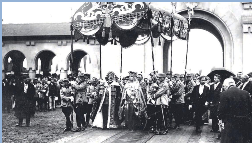
Încoronarea de la Alba Iulia 15 octombrie 1922