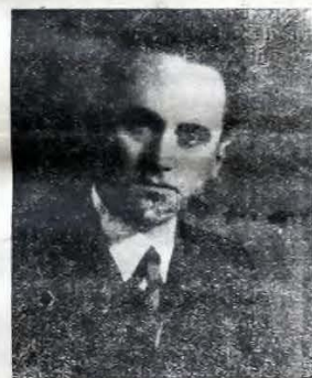
† ION MOȚA

Regulamentul acestui concurs se va trimite la cerere oricărui interesat.