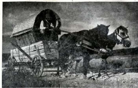
„Cum trăiesc seculi