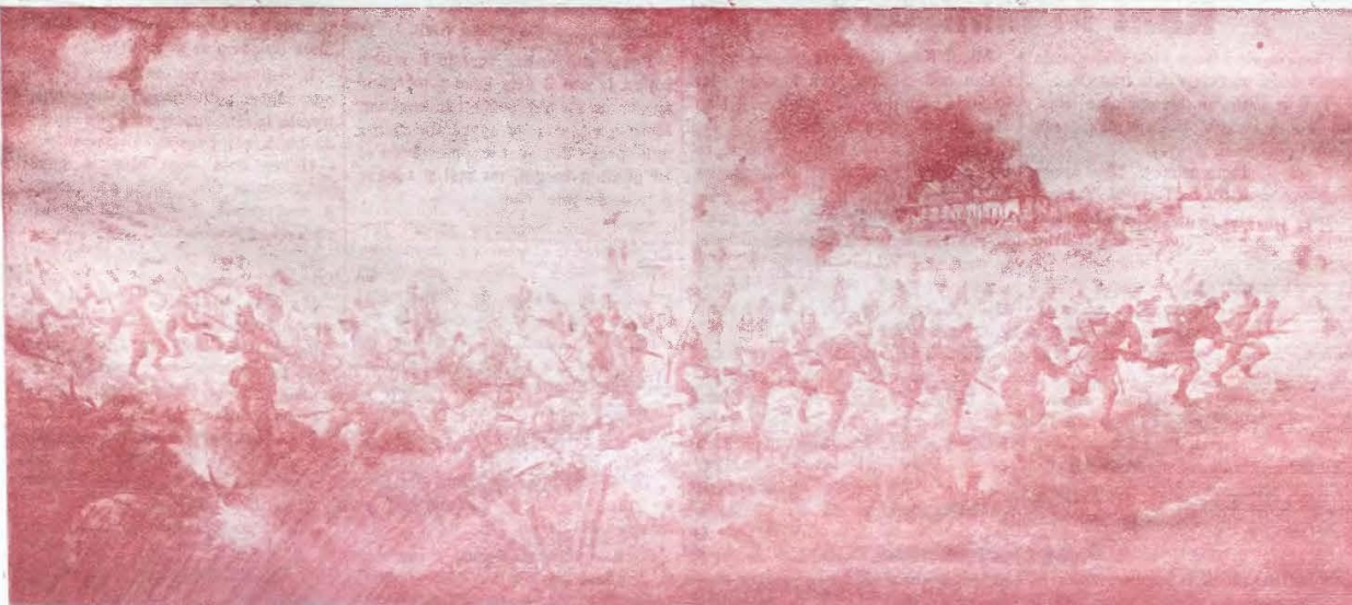
Fotografia reprodușă după un admirabil tablou pictat de d. col. D Rădulescu

Sacrificiul suprem al amatei românești a sfârșit trupel generalului Von Mackensen supra-numit „spărgătorul de fronturi”, care în timpul bătăliei a și părăsit teritoriul de luptă, plecând în Germania. Col D. Rădulescu