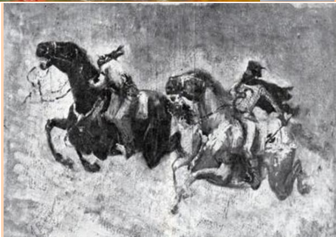
Mihai-Vodă, urmărindu-l pe Hassan Pașa - Desen de Apcar Baltazar

Și-n ceasul acela Hassan a jurat Să zacă de spaimă o lună, Văzut-au și beii că fuga e bună Și bietului pașă dreptate i-au dat, Căci Vodă ghiaurul, în toți a băgat, O groază nebună. (Fire de tort, 1892)