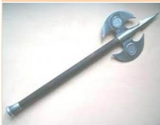
Barda, mânăuită fulgerător de brațul eroic al lui Mihai Viteazul, la Călugăreni - replică rasfoiesc.com

Iată cum prezintă George Topârceanu faptele de la Călugăreni ale Marelui Voievod valah, în poezia „Mihai Viteazul și turcii”: