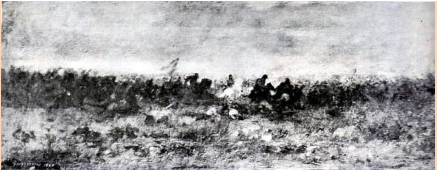
Nicolae Grigorescu-ulei pe pânză: "Bătălia de la Călugăreni"

Dacă pictorii Nicolae Grigorescu și Theodor Aman descriu bătălia cu ajutorul penelului, George Coșbuc, la rândul său, pune în versuri curajul uimitor și mărețele fapte ale lui Mihai. El ne-a lăsat o superbă și expresivă poezie închinată Marelui Mhai-Voievod Viteazul, referitoare la strălucita victorie de la Călugăreni.