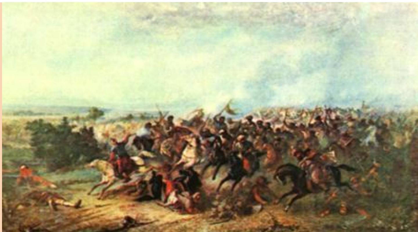
„Izgonirea turcilor-Bătălia de la Călugăreni” - Pictură de Theodor Aman.

Poezia scoate în evidență demnitatea și spiritul de sacrificiu de care dă dovadă Domnul valah. Aceste calități l-au ridicat în ochii tuturor, ca erou al neamului. Mihai Viteazul impresionează prin măreția trupului, asprimea vorbei, cutezanța faptei, însușiri de care nu mulți conducători de oști au dat dovadă de-a lungul timpului. În contrast cu faptele lui Mihai, pașa Hassan, văzând moartea cu ochii groazei, desfigurat de spaimă, alege în mod laș, fuga. Sunt recuperate tunurile, fiind uciși multe mii de combatanți turci (unii istorici îi apreciază la 7.000). Lăsarea nopții a oprit măcelărirea completă a osmanlâilor. Bătălia de la Călugăreni a durat o zi întregă și a constat într-o serie atacuri și cotraatacuri. După unsprezece ceasuri de bătălie, românii s-au întors triumfători în tabăra lor, încărcăți cu prăzi bogate. Pe