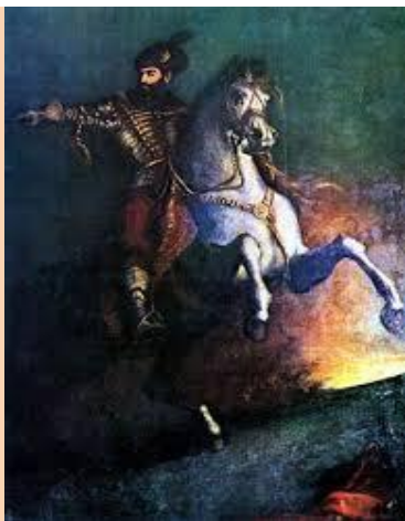
Mihail Lapaty - cunoastelumea.ro

Cronicarul turc Ibrahim Pecevi, scrie referitor la ceea ce s-a întâmplat la Călugăreni: „Din voia lui Allah, oastea islamică a fost cuprinsă de o mare spaimă, încât nu putea să opună nici o împotrivire.” Prin atacul de la Călugăreni, Mihai reușise să-și atingă obiectivele: a provocat pierderi importante dușmanului, l-a demoralizat și a întârziat înaintarea turcilor, spre Târgoviște și București, câștigând timpul necesar pentru refacerea și concentrarea forțelor antiotomane într-un loc prielnic. Turcii erau încă mult prea mulți, iar întăririle lor se aflau pe drum. Spionii lui Mihai îl avertizaseră deja de iminența sosirii lor. Deci Mihai trebuia să se retragă, neavând încotro, lăsând liber invaziei otomane în Valahia. Într-un consiliu de război, Mihai-Vodă a hotărât să-și dirijeze oștirea către munți, unde aștepta ajutoare din Transilvania și Moldova .