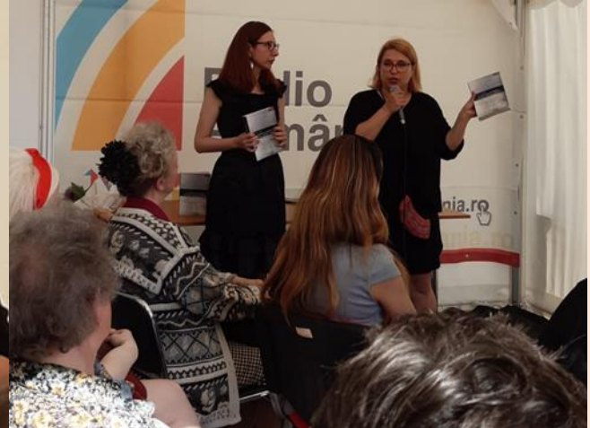
Aspecte de la târg - lansare