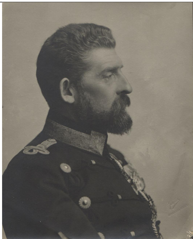
Ferdinand – fotoportret de la eveniment

Dați-ne voie, nouă, membrilor Asociațiunii pentru literatura română și cultura poporului român , cea mai veche și cea mai mare însoțire culturală a Românilor de dincoace de Munți, să dăm expresiune bucuriei nemărginite, ce o simțim cu toții, când vedem în mijlocul nostru pe primul Rege al României întregite , pe marele Căpitan, vitejiei și înțelepciunii căruia datorăm în prima linie liberarea noastră și recâștigarea granițelor de odinioară ale Daciei străbune , însoțit de nobila și neîntrecuta noastră Regină.