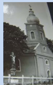
Biserica din Portița

De dată recentă am aflat despre faptul că, în Biserica din Portița, s-a păstrat, o vreme, o importantă Stampă 4 (foto 1) care dovedește pe de o parte legăturile preoților cu fruntașii revoluției de la 1848 iar pe de altă parte strădania lor de a aduce în lăcașul sfânt simbolurile și idealurile luptei românilor pentru afirmarea drepturilor lor naționale. În acest sens, de altfel documentele de arhivă demonstrează că, episcopii Diecezei de Oradea – greco- catolică – au activat prin gazetele vremii – Foaie pentru minte inimă și literatură , Gazeta de Transilvania – precum și prin tipărirea unor importante lucrări românești despre