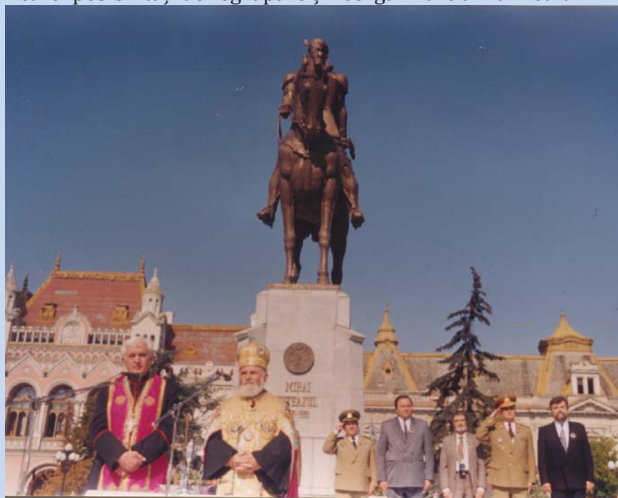
19 august 1994-Oradea-Dezvelirea și sfințirea statuii Marelui Vodă Mihai

-eliminarea oricărei posibilități de regrupare și reorganizare a inamicului