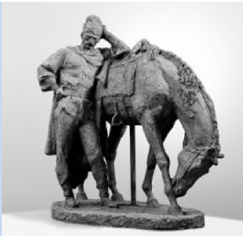
Baba Novac

-pârjolirea terenului pe care urma să-l parcurgă dușmanul, pentru a-i crea dificultăți cu aprovizionarea alimentară, materială, sau de altă natură