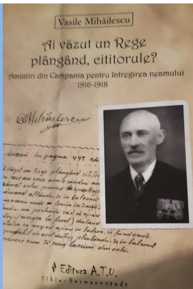
Volum prefăcut și îngrijit de prof. Mihail Adafini