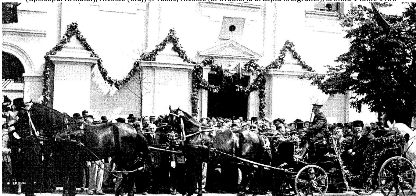
Oradea - 28 iunie 1936 – la Biserica cu Lună în caleașca împodobită, trasă de 4 cai