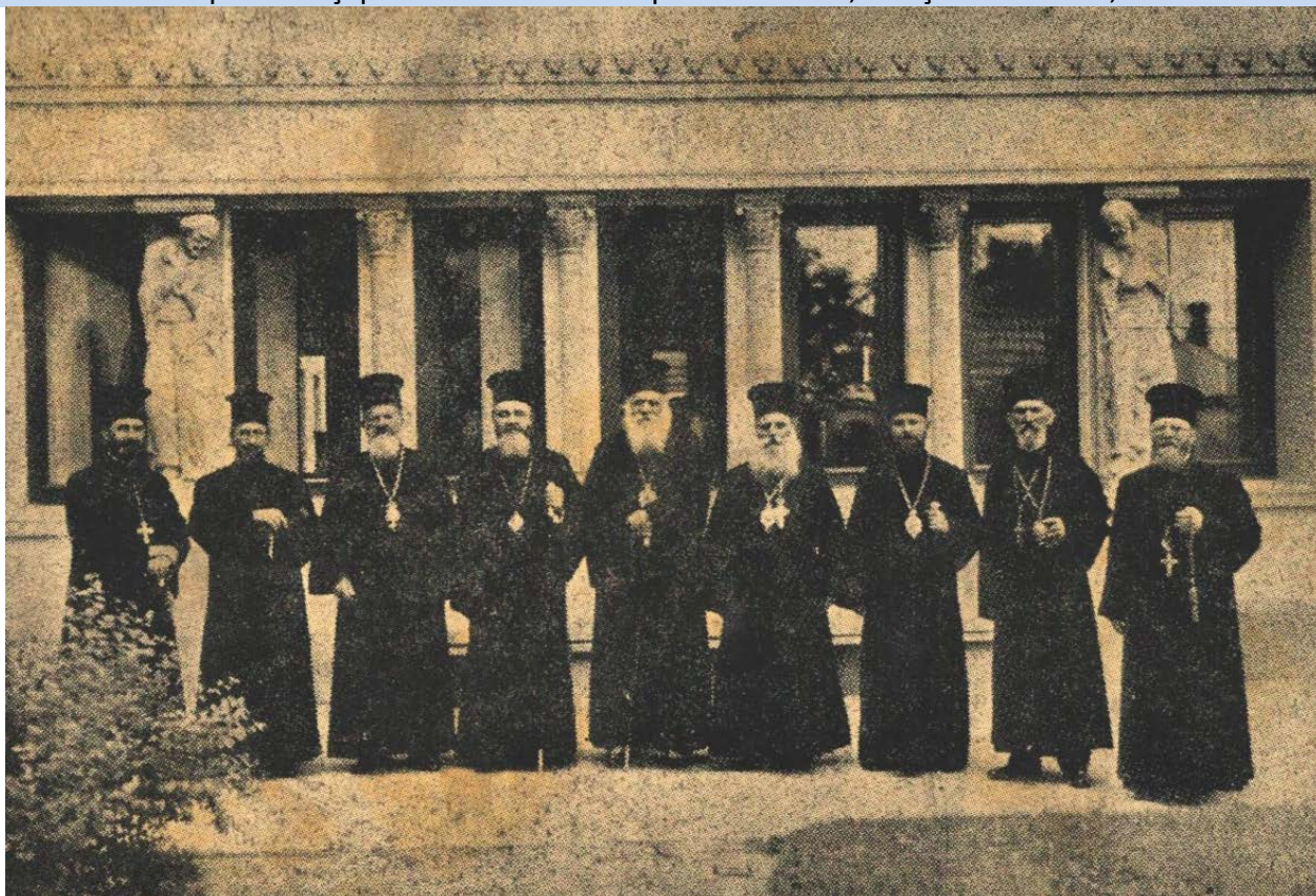
Mitropoliții Nicodim, al Moldovei, și Nicolae al Ardealului, PS Vartolomeu (Râmnic), Ghenadie (Buzău), Andrei (Arad), Ioan (Episcopul Armatei), Nicolae (Cluj) și Vasile, Nicolae (al Oradei la dreapta fotografiei), la Sibiu 1 iunie 1936