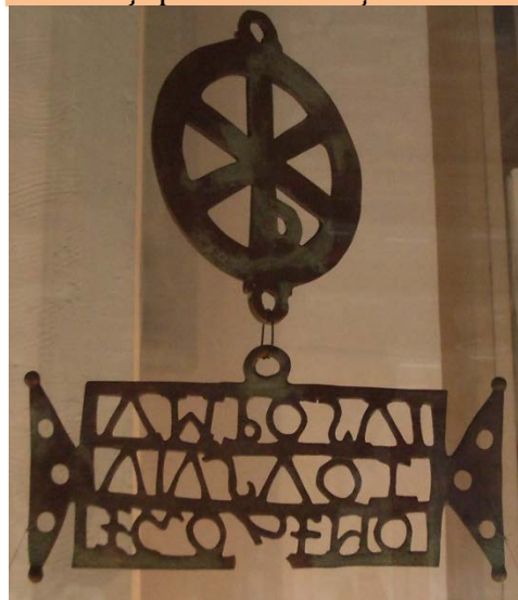
Donariul de la Biertan

Cu ajutorul lui Dumnezeu, voi publica în curând ediția integrală a monografiei Nicolae Popovici, aflată în curs de finalizare, pentru ca astfel să putem comensura în cât mai mare măsură adevăratele dimensiuni ale vieții, misiunii, personalității și rolului însemnat pe care l-a avut în vremea sa și după aceea acest mare ierarh, teolog și patriot de excepție, ce s-a dăruit mistuitor pe sine pentru mai binele tuturor și pentru biruința luminii credinței creștine în sufletul neamului românesc.