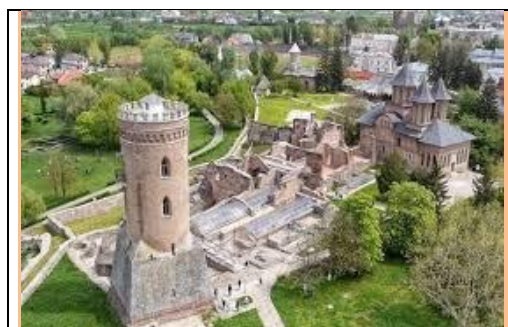
Târgoviște -Curtea Domnească- Turnul Chindiei și ruinele

de donjon al cetății. În acea vreme, numai cei veniți cu gânduri pașnice și cei anunțați, puteau ajunge aproape de turn, el având un rol militar de prim ordin: punct de observație și mai apoi, închisoare. În interior, pe zidurile sale, faptele și portretul lui Vlad Țepeș sunt prezentate cu lux de amănunte.