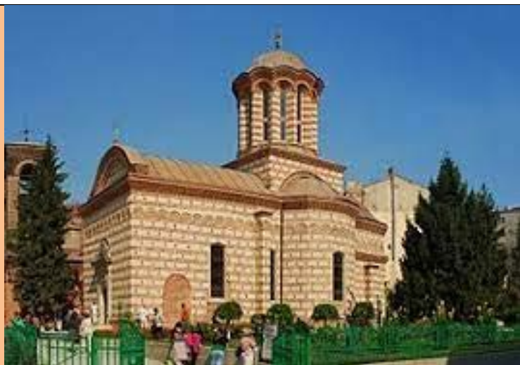
Biserica Curții Domnești

Cetatea Domnească a trecut prin numeroase refaceri, extinderi și renovări, de-a lungul domniilor ce s-au perindat, începând cu Vlad Țepeș, până la Constantin Brâncoveanu.