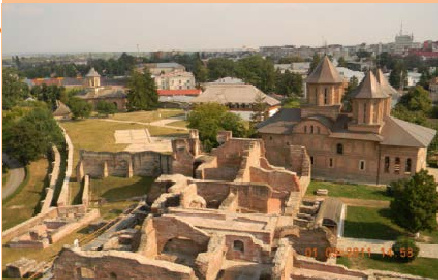
Târgoviște-Curțile Domnești

Matei Basarab face un coridor-racord ce unește două clădiri ale palatului și construiește un etaj, parțial pe aripa veche.