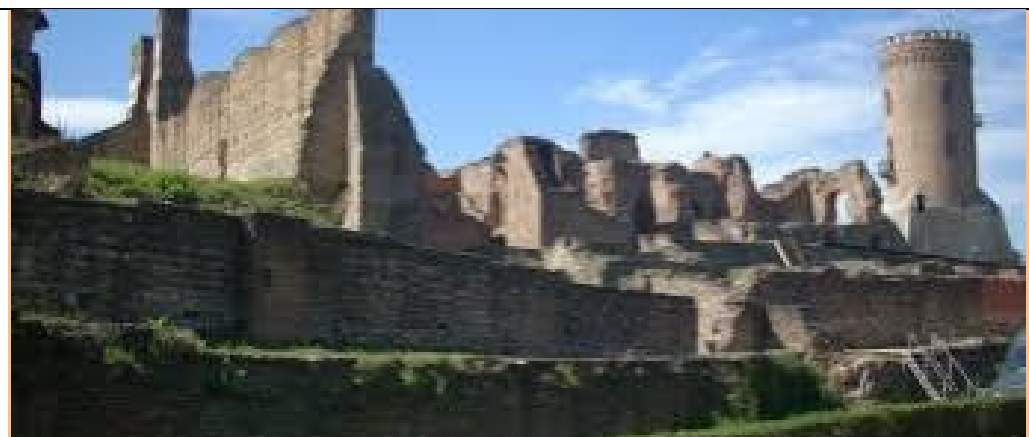
Târgoviște-Cetatea de scaun a celor 40 de voievozi români. Ruinele.

Turnul Chindiei, monument emblematic pentru municipiul Târgoviște, a fost construit de către domnitorul Vlad Țepeș, în jurul anului 1460. Înalt de 27 de metri, rolul acestui turn era probabil acela