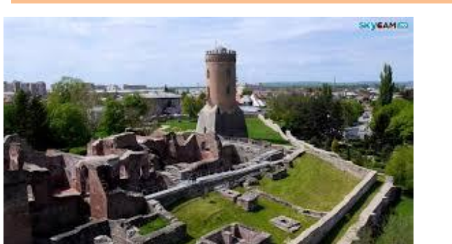
Târgoviște - Curtea Domnească a voievozilor valahi-ruinele.

Biserica Mare Domnească este ctitoria voievodului Petru Cercel, după modelul bisericii mitropoliei din oraș, însă de dimensiuni mult mai mari, fiind la data construcției, cea mai mare clădire religioasă din Țara Românească. Pictura, păstrată până în zilele noastre, este realizată integral între anii 1696-1698, în timpul domniei lui Constantin Brâncoveanu, conținând cea mai amplă galerie de portrete de domnitori munteni.