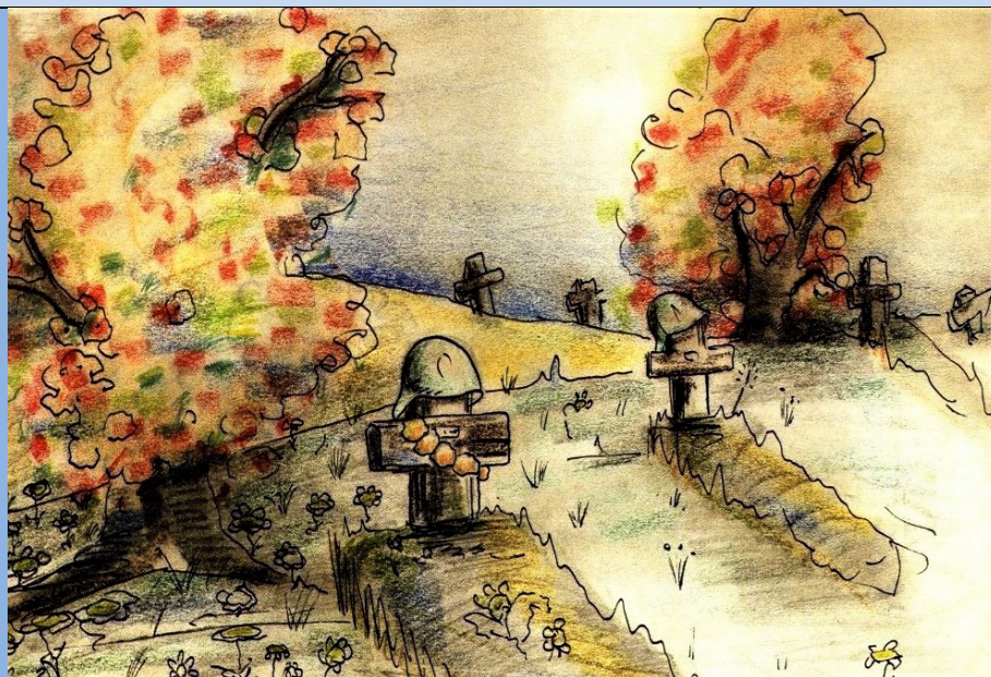
Cimitir de campanie – autor necunoscut